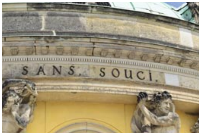
Abb. 2 Friedrichs II. Schreibweise