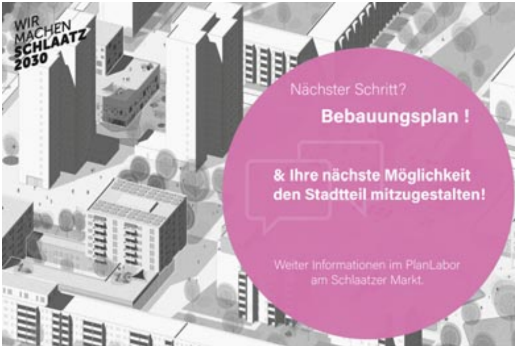
© Octagon Architekturkollektiv (2022), Bearbeitung Stadtkontor (2023)

Viele Bewohner:innen des Stadtteils haben sich in den vergangenen Wochen im PlanLabor erkundigt, wie es mit dem Masterplan nun weitergeht. Oftmals gab es Sorgen und Ängste, wie die Umsetzung in den nächsten Jahren aussieht.