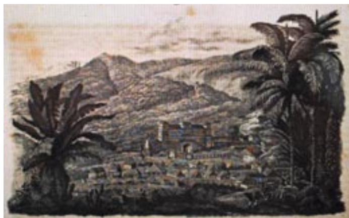
Abb. 3 Sans=Souci in Haiti 1841